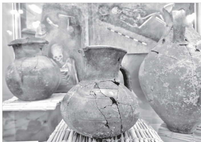
Фрагменты экспозиции выставки.

На презентации выставки ведущая отделом археологии