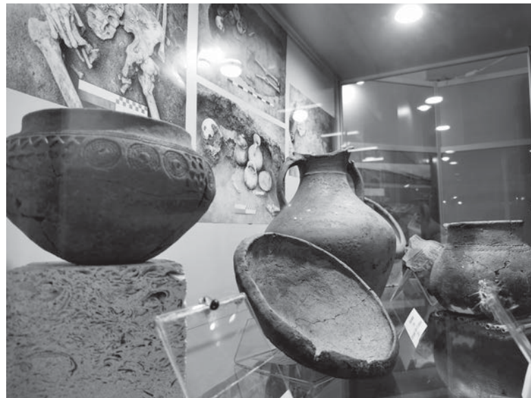
Фрагменты экспозиции выставки «Археолог А.А. Калмыков: полевые исследования древних курганов Ставрополья».